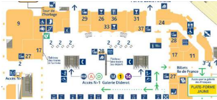
Hall 1 拡大図 Plan Hall 1